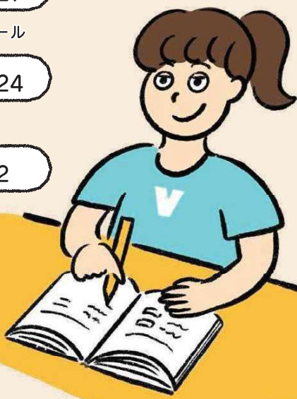
Vivaちゃん © CHIDORIPEN