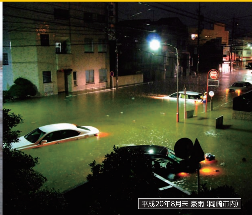
平成20年8月末 豪雨 (岡崎市内)