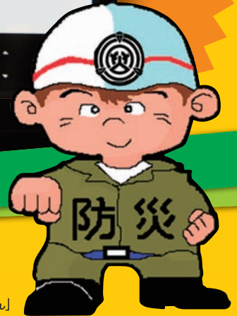
イメージキャラクター「防災くん」