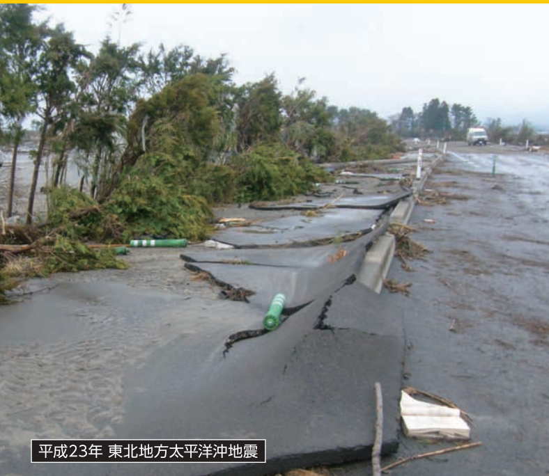
平成23年 東北地方太平洋沖地震